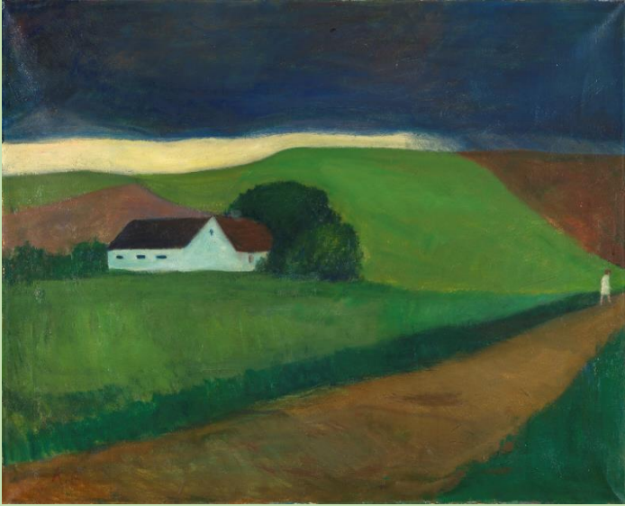
Kaj Ejstrup Husmandssted ved Skamlebæk, uden årstal. Odsherreds Kunstmuseum