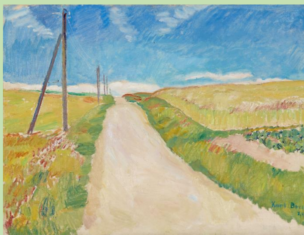
Karl Bovin: Landevej gennem kornmark, 1945. Odsherreds Kunstmuseum.