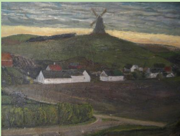
Karl Bovin: Ordrup Mølle, 1930. Odsherreds Kunstmuseum.