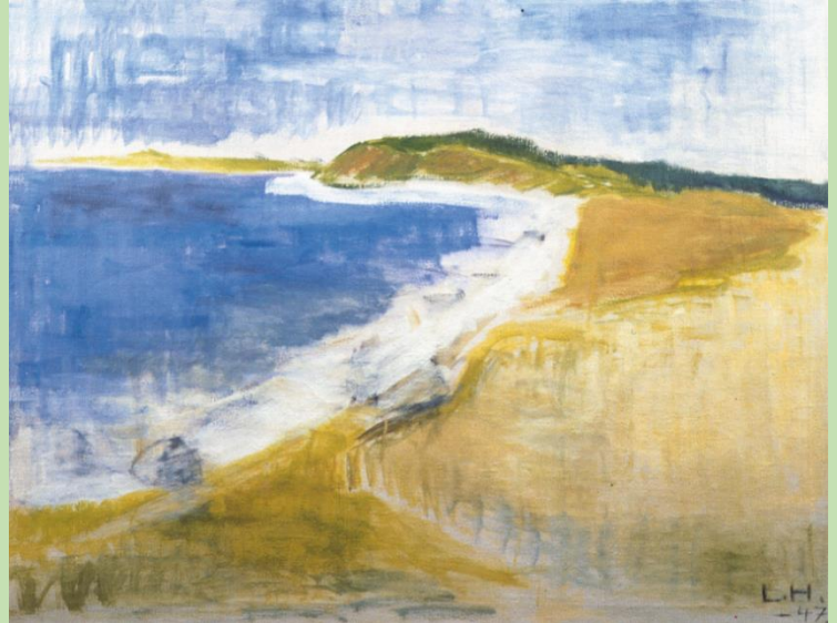
Lauritz Hartz: Parti fra Ordrup Næs, 1947. Odsherreds Kunstmuseum.