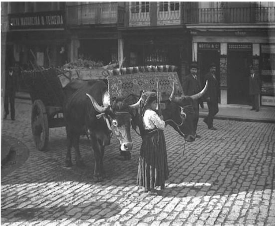
Pige med en kærre i Porto, Portugal.

Gå på opdagelse i børnearbejdernes verden i dag