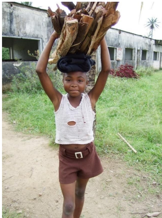
Børnearbejder i Madagaskar i vores tid.

Kom i gang ved at tale om de nedenstående billeder sammen i klassen.