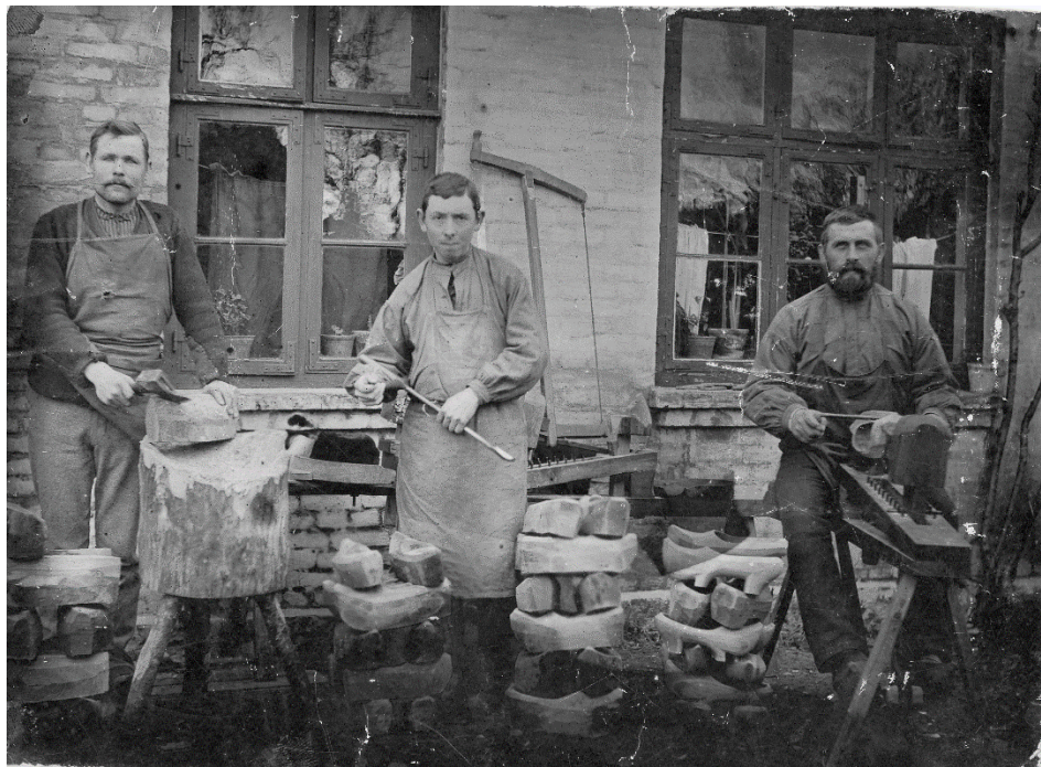
Ringsted træskofabrik, begyndelsen af 1900-tallet.

Kort beskrivelse: Knofedt og maskinkraft er et dialogbaseret undervisningsforløb, som finder sted på Ringsted Museum og Ringsted Mølle. Forløbet tager et komparativt blik på børnearbejdernes vilkår på landet og i byen i Danmark i perioden 1850- 1920. Gennem levende fortælling og hands-on aktiviteter opfordres eleverne til at reflektere over vilkår for børnearbejdere i gamle dage og perspektivere deres viden i forhold til børnearbejdernes vilkår i andre lande i dag.