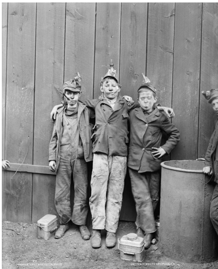
Arbejdsdrenge "Breaker Boys", Kingston, PA USA 1900-1910.

Kom i gang ved at tale om de nedenstående billeder sammen i klassen.