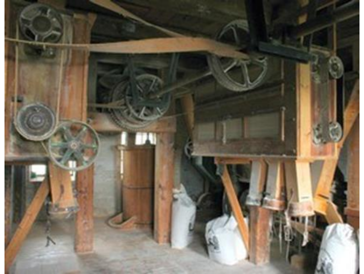
Ringsted Mølle