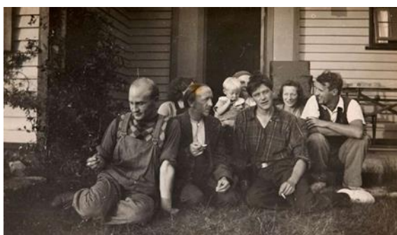
Odsherredsmalerne, 1930'erne. Privat foto.

Forløbet indledes med en dialog om kunstbegrebet og en fortælling om Odsherredsmalerne. Vi kigger på spørgsmål som: Hvad er kunst og hvad kan og skal kunst i samfundet? Hvordan bliver idéer, følelser, oplevelser og inspiration fra den virkelige verden omsat til et kunstværk? Hvem var Odsherredsmalerne, og hvad var det særlige ved deres univers? Hvad ville de med deres kunst? Ud over udvalgte værker i samlingen inddrages kulturhistorisk billedmateriale, sjove fortællinger og sansede iagttagelsesaktiviteter for at levendegøre det kunst- og kulturhistorisk materiale.